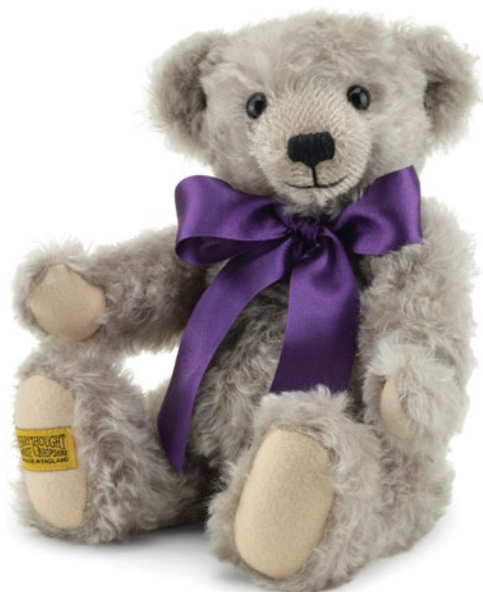
G5815113 (SNN12CR) チェスター 12" H=30cm 35,200 yen (本体価格 32,000 yen)