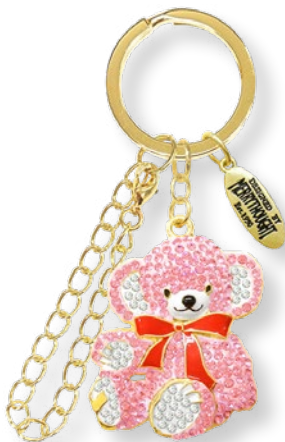
E2187202 ストーンピンク 1,650 yen (本体価格 1,500 yen)