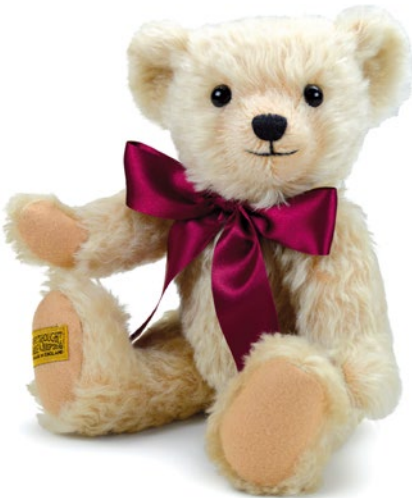
G5817107 (HNY12BL) ヘンリー 12" H=30cm 35,200 yen (本体価格 32,000 yen)