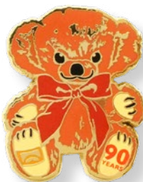
E2171802 チーキー 90TH 935 yen (本体価格 850 yen)