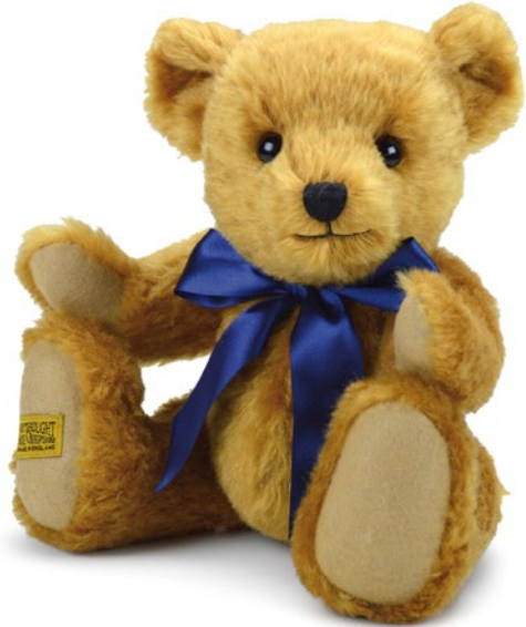
G5817110 (OX13G) オックスフォード 13" H=33cm 39,600 yen (本体価格 36,000 yen)