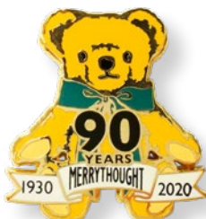
E2171806 90TH GR 935 yen (本体価格 850 yen)