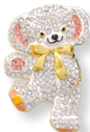
E2171701 ストーン クリア 1,045 yen (本体価格 950 yen)