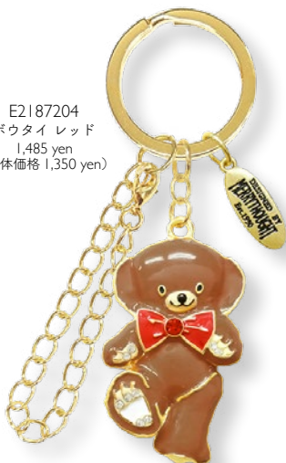
E2187204 ボウタイレッド 1,485 yen (本体価格 1,350 yen)