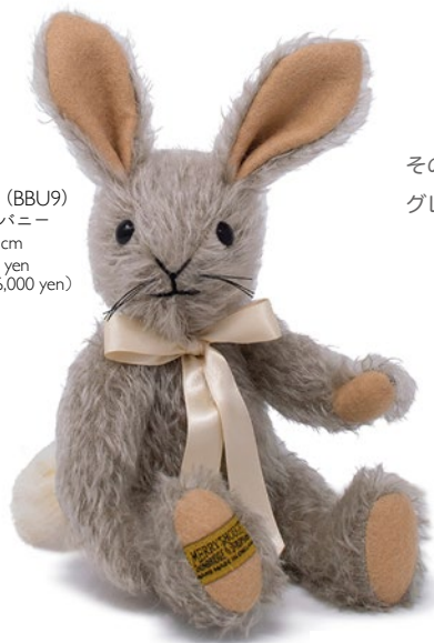
G5814109 (BBU9) ビンキーバニー H=23cm 28,600 yen (本体価格 26,000 yen)