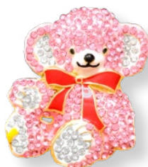
E2171702 ストーン ピンク 1,045 yen (本体価格 950 yen)