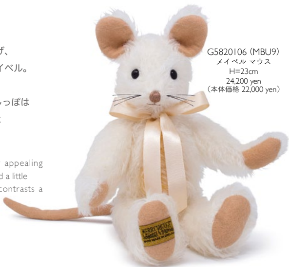
G5820106 (MBU9) メイベルマウス H=23cm 24,200 yen (本体価格 22,000 yen)