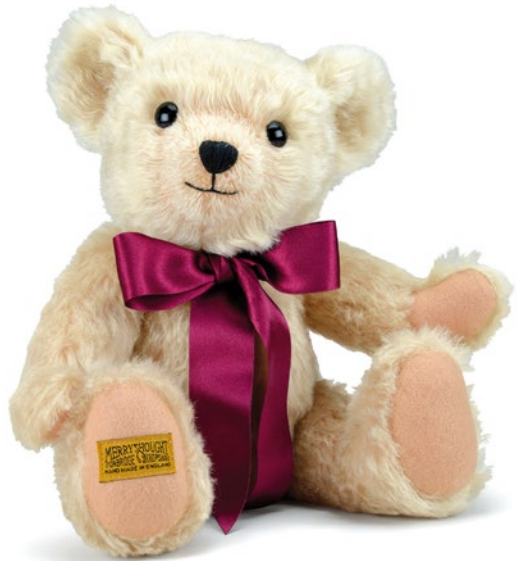
G5817108 (HNY14BL) ヘンリー 14" H=35cm 40,700 yen (本体価格 37,000 yen)