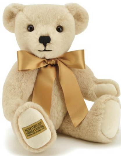
G5820108 (RXS12ST) ストラットフォード 12" H=30cm 29,700 yen (本体価格 27,000 yen)