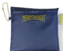
収納ポケット付き (一体型)