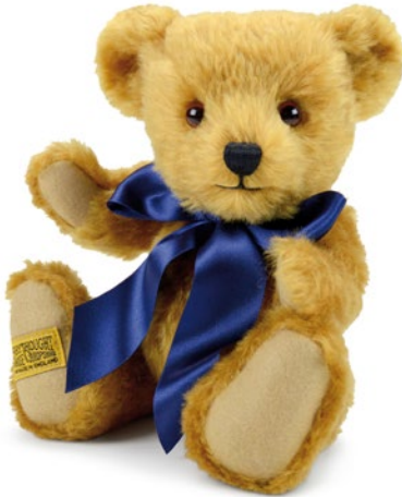
G5817109 (OX10G) オックスフォード 10" H=25cm 29,700 yen (本体価格 27,000 yen)