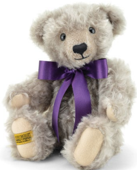
G5815112 (SNN10CR) チェスター 10" H=25cm 31,900 yen (本体価格 29,000 yen)