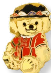
E2171804 ビーフィーター 935 yen (本体価格 850 yen)