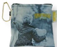
収納ポケット付き (一体型)

E4241501 ネイビー ポケット W50×H65×D10 (cm) 1,650 yen (本体価格 1,500 yen)