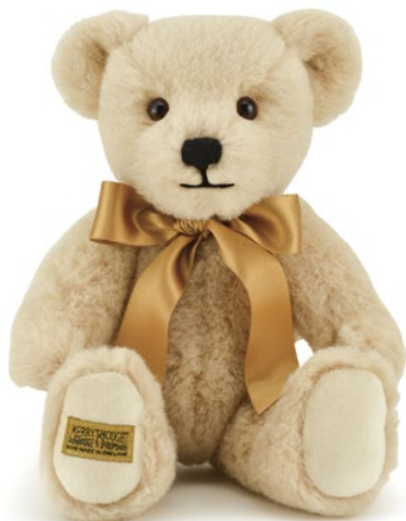
G5820107 (RXS10ST) ストラットフォード 10" H=25cm 25,300 yen (本体価格 23,000 yen)