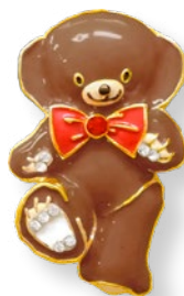
E2171704 ポウタイ レッド 715 yen (本体価格 650 yen)