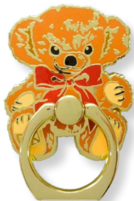
E2187301 チーキーリボン 1,485 yen (本体価格 1,350 yen)