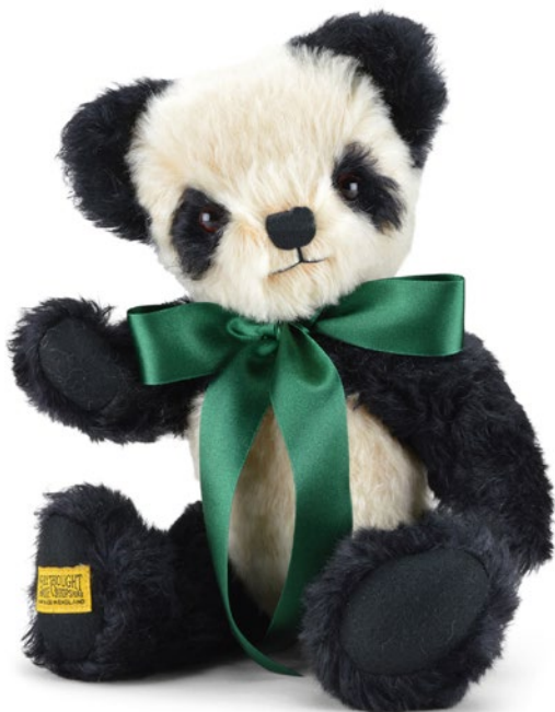
G5812127 (API4BC) アンティークパンダ 14" H=35cm 42,900 yen (本体価格 39,000 yen)