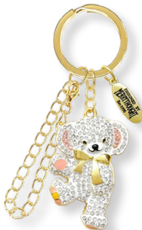
E2187201 ストーンクリア 1,650 yen (本体価格 1,500 yen)