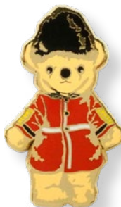
E2171803 ガードマン 935 yen (本体価格 850 yen)