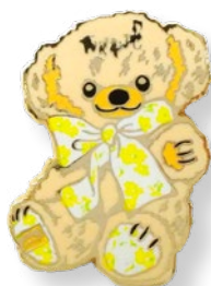
E2171801 チーキー フラワー 935 yen (本体価格 850 yen)