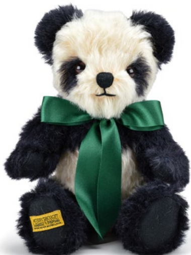
G5817105 (API0BC) アンティークパンダ 10" H=25cm 31,900 yen (本体価格 29,000 yen)