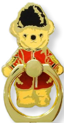
E2187302 ガードマン 1,485 yen (本体価格 1,350 yen)