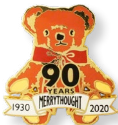
E2171805 90TH RD 935 yen (本体価格 850 yen)